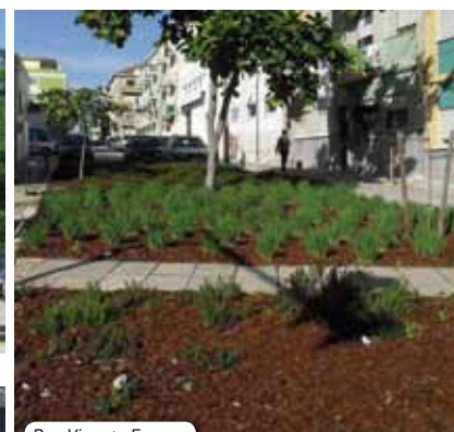
Rua Vicente França