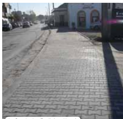
Av. Escola dos Fuzileiros Navais