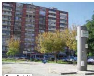
Praça Paulo VI

Salientamos da intervenção feita até Novembro a recuperação de uma sala de multideficiência na Escola 8, a substituição de janelas de madeira, por janelas de alumínio na Escola 4 e a substituição de um telhado na Escola da Telha Nova.