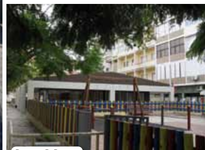
Praceta D. Duarte