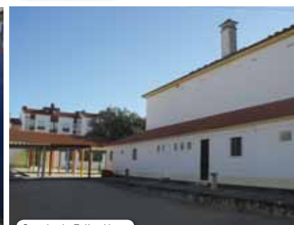
Escola da Telha Nova