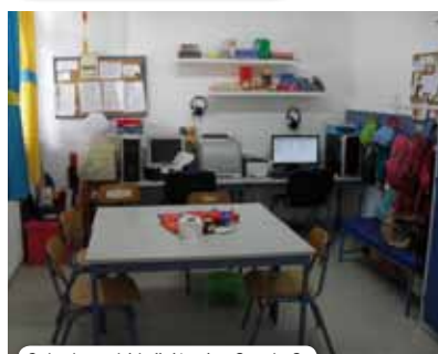
Sala de multideficiência - Escola 8