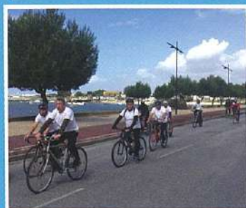
Prova Cicloturismo 25 de Abril