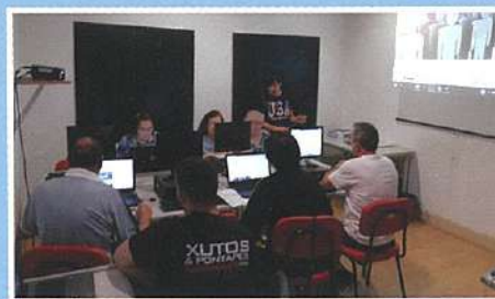
Aulas de Informática para Seniores