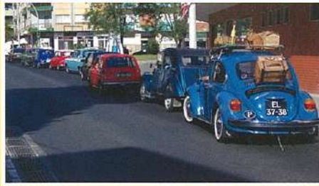
Passeio de Automóveis Antigos e Clássicos