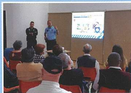
Ação de Sensibilização "Terceira Idade em Segurança"