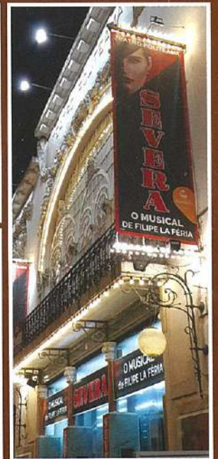
"Os Vizinhos de Cima" "God" "Severa"