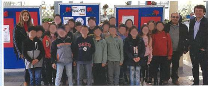
Concurso Express'Arte Liberdade (25 de abril)