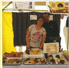
Feira do Biscoito