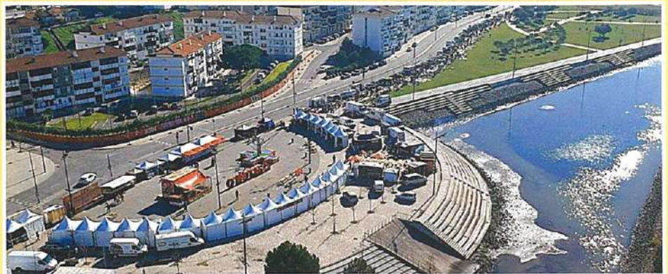
Feira do Fumeiro