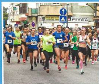
Milha da Liberdade