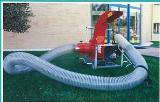
Aspirador de folhas

Aquisição de aspirador de folhas e tratores para deservagem, investindo na proteção ambiental.