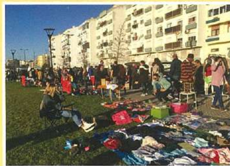
Feira da Bagageira