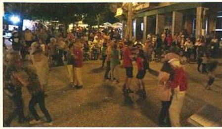
Baile de Verão