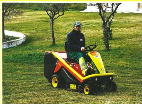
Novo trator corta-relva

Procedeu-se à aquisição de novos equipamentos visando a melhoria contínua do serviço prestado à população e consequente reforço das condições de segurança dos colaboradores.