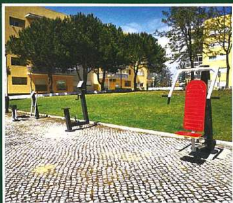
Rua Ferrer Trindade