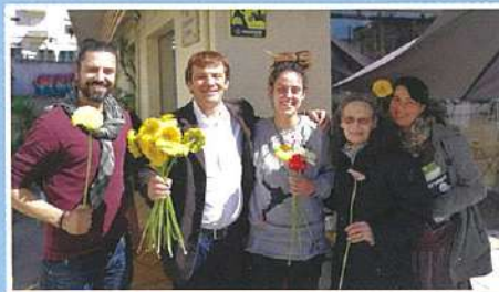
Comemorações Dia da Mulher