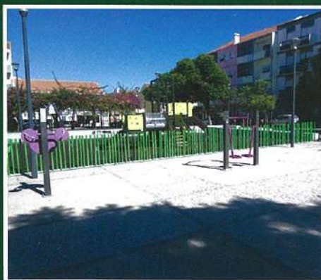
Praça S. Francisco Xavier