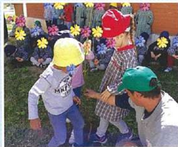
Dia Mundial da Árvore plantação de árvores e flores