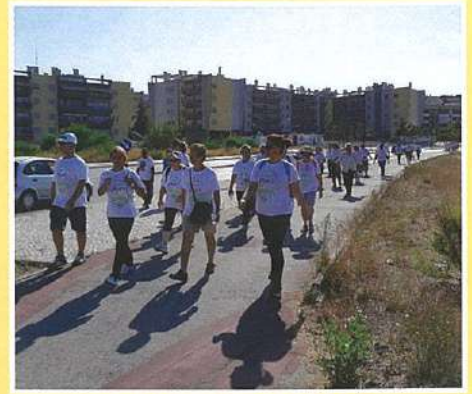
Passeio da Memória