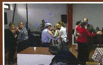
Vale da Rosa, Herdade do Pinheiro e Lagar do Azeite Oliveira da Serra