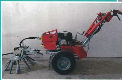
Tratores de deservagem