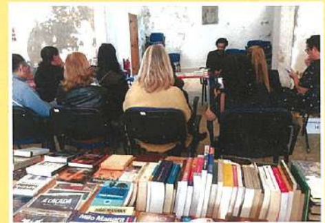
Feira do Livro em 2ª mão