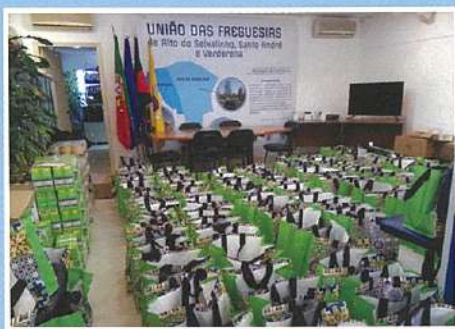
Cabazes Natal para famílias